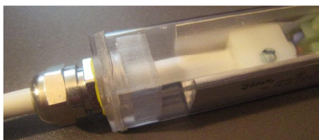
Bild 9 Visar återmonterad ändpropp

Montering och lampbyte se monteringsanvisningen