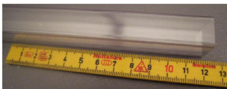
Bild 8 Kapa fyrkantsröret som u-profilen se bild 3