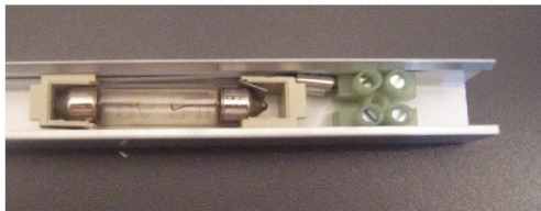
Bild 2 Utdragen aluminium u-profil ur fyrkantsröret

Använd skarpa verktyg vid bearbetning av belysningslisten. Vid tveksamhet om hur man går tillväga kontakta återförsäljare eller behörig elektriker.