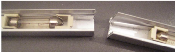
Bild 4 Såga av al listen med en skarp bågfil