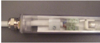
Bild 1 Dra isär ändproppen på sladdsida från fyrkantsröret

Använd skarpa verktyg vid bearbetning av belysningslisten. Vid tveksamhet om hur man går tillväga kontakta återförsäljare eller behörig elektriker.