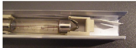
Bild 5 Vik ut kontaktbandet